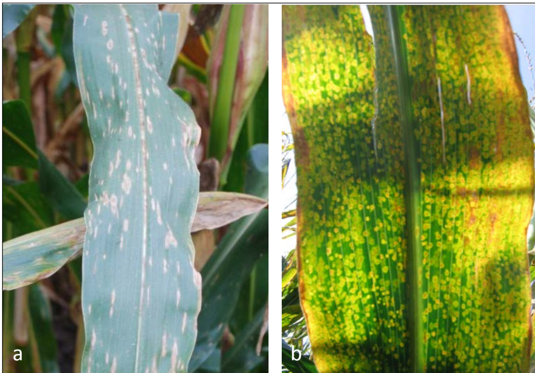
Abb. 4: Durch Cochliobolus carbonum verursachte Carbonum Blattflecken (a) und durch Aureobasidium zeae verursachte Augenflecken (b)

Zwei weitere durch pilzliche Erreger verursachte Blattkrankheiten, die Augenfleckenkrankheit ( Aureobasidium zeae ) und Carbonum Blattflecken ( Cochliobolus carbonum ) sind ebenfalls in Deutschland anzutreffen. Die Erreger dieser beiden Krankheiten bevorzugen moderate bis kühl-feuchte klimatische Bedingungen. Beide Krankheiten konnten im Jahr 2011 verstärkt in den nördlichen Anbaugebieten in Deutschland beobachtet werden. Die Augenfleckenkrankheit zeichnet sich durch kleine, runde Flecken mit braun-rötlichem Zentrum aus, die von einem gelbem Hof umgeben sind. Unter kühlen und feuchten Bedingungen erfolgt eine Gelbfärbung und vorzeitiges Absterben der befallenen Blätter. Carbonum Blattflecken können in ihrer Form und Größe variieren, sind jedoch kleiner und schmaler als Helminthosporium Blattflecken (Abb. 4).