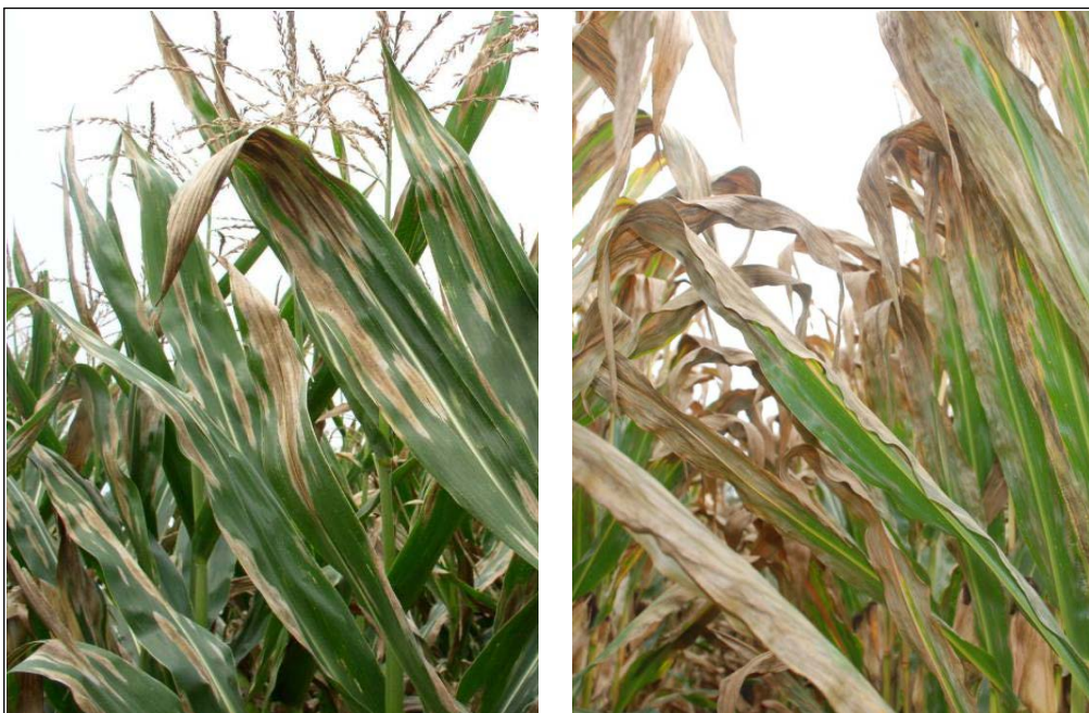
Abb. 1: Durch Setosphaeria turcica verursachte Helminthosporium Blattflecken

Die durch den Pilz Setosphaeria turcica hervorgerufene Helminthosporium Blattfleckenkrankheit ist seit längerem in wärmeren Anbaugebieten in Europa anzutreffen und hat sich seit Mitte der 90er-Jahre auch in Süddeutschland etabliert. Ende der 90er-Jahre wurden dort erstmals stärkere Ertragsausfälle durch Helminthosporium Blattflecken beobachtet. In den letzten Jahren hat sich die Krankheit bis in die nördlichen Maisanbaugebiete Deutschlands ausgebreitet. Das Schadbild zeichnet sich durch spindelförmige hellgraue Flecken auf den Blättern aus, die bei starkem Befall ineinanderfließen und bei anfälligen Sorten zu vorzeitigem Absterben der Blätter führen (Abb. 1).