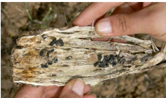
6 Vermorschter Stängel mit Sklerotien von Sclerotinia sclerotiorum