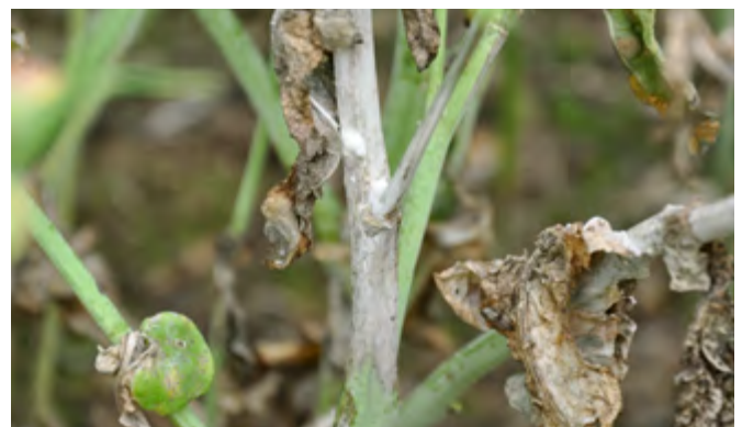
5 Sklerotiniabefall am Stängel