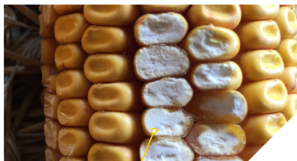
Grain denté farineux Pioneer