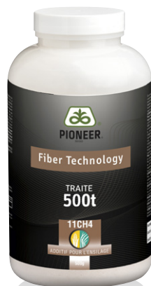
Flacon de 500 g (500 tonnes brutes traitées)

À DÉCOUVRIR EN VIDÉO : le mode d'action et les bénéfices de 11CH4