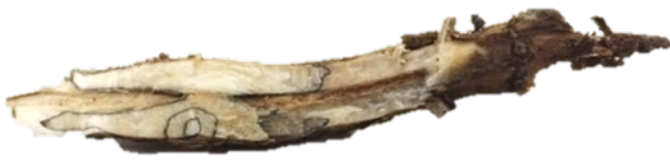
Figure 1. Les lignes de zones sombres dans la section longitudinale inférieure de la tige révèlent une infection par le champignon Diaporthe .