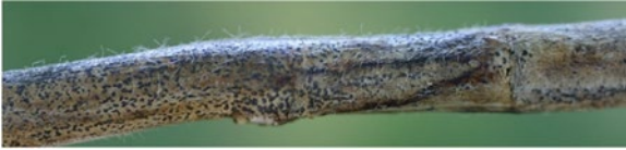
Figure 4. Des microsclérotés noirs et poussiéreux disposés de manière désordonnée sur la tige extérieure sont un symptôme caractéristique de la pourriture du charbon.