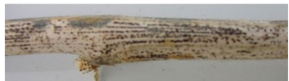
Figure 2. Le soya infecté par la maladie de la gousse et de la tige présente des taches noires en rangées linéaire.