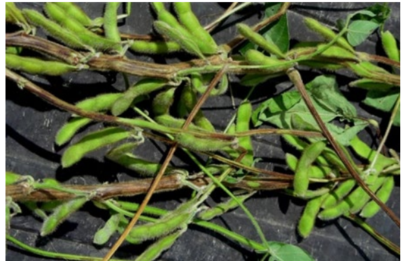
Figure 6. Chancre des tiges du soya causé par le champignon Diaporthe.