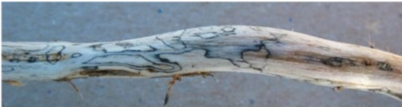
Figure 5. Les lignes de zones sombres dans la section longitudinale inférieure de la tige révèlent une infection par le champignon Diaporthe.