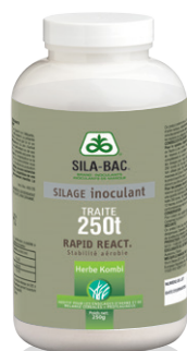
Flacon de 250 g (250 tonnes brutes traitées)