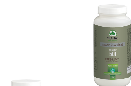
Flacon de 50 g (50 tonnes brutes traitées)