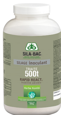
Flacon de 500 g* (500 tonnes brutes traitées)

À DÉCOUVRIR EN VIDÉO : le mode d'action et les bénéfices de la technologie Rapid React